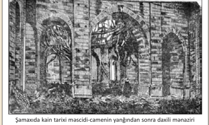
Şamaxıda kain tarixi məscidi-camenin yağığndan sonra daxili manaziri

Təzəpır məscidində – haman keçən il bu günlərdə düşmən mərmiləri dayıdıca, yaralanan pəhlivan gipi nərə çəkərək guya zəbanı-hal ilə [hal dılı ilə] "Ey Türk milləti! Namusun qəbul etməsin! Allah, götürmə bu zülümü!" deyə fəryad edən bu böyük məscidin həyatında cəmmi-kəsirin [böyük qəlabəliyin] İştirakilə İctima [yığıncəq] tərtib verəcəklərdi.