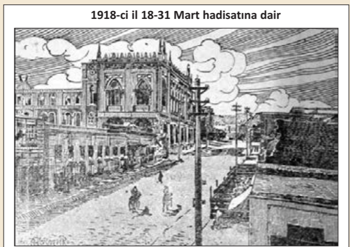
Yağığndan sonra "İsmaliyyə" imarəti, "Açıq söz" və "Kəsp" qəzetlərinin manzəraləri

Bu gün; gözəl idəyə, böyük şüar altında qara fikir yürüdüən bir taqım alçaq qarəğürhün əlinə məqtl düşənlərin [qətl edilənlərin] İllyidir. Bu matəmədə azərbaycanlılar məscidlərə yığılaraq gühəşiz özlərin, irz və namusuna toxunulmuş məzmlunları, canilər əlinə tələf olmuş məşum çocuqları yad edəcəklər, Quran oxuyacaqlar, məzmlulara rəhmət, zalımlara lənətnamə olacaqlardır.