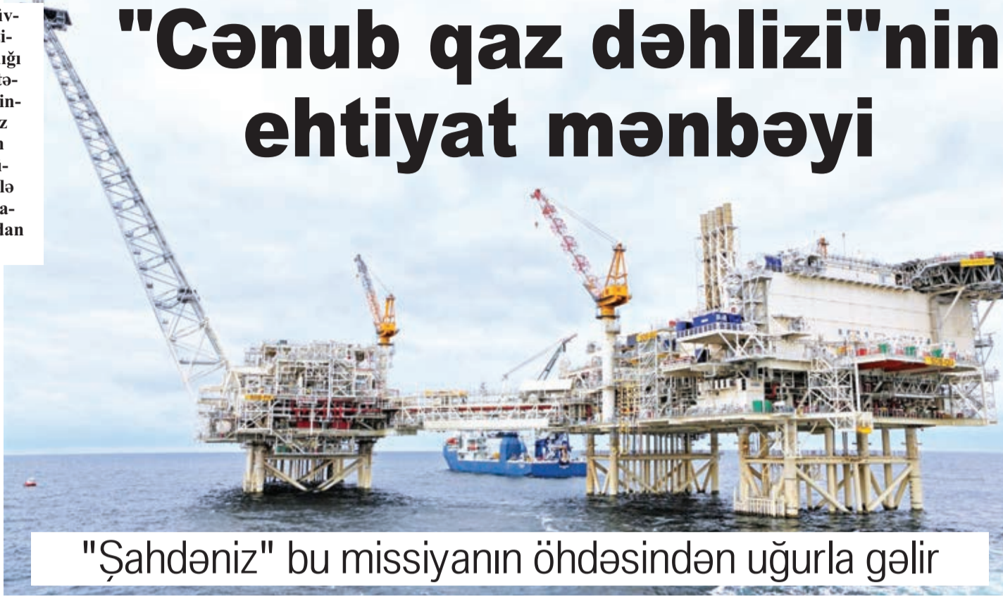
"Şahdəniz" bu missiyanın öhdəsindən uğurla gəlir

Rəsmi məlumata görə, işğal dövründə Qarabağda 10-dək su anbarı, 7 sututarı, 6426 kilometr uzunluqda suvarma şəbəkəsi, 2 hidroqovşaq, 330 kilometr uzunluqda kollektor-drenaj şəbəkəsi, 8003 hidrotexniki qurğu, 88 nasos stansiyası, 1429 oədə subarbazian quyusu olub. Ümumilikdə Azərbaycanın 125 800 hektar suvarılan torpaq sahəsi işğal altında qalmışdı. İşğaldan azad olunan ərazilərin çaylar, göllər, o cümlədən yeraltı suların ibarət su ehtiyatları təxminən 780 milyon kubmetr hesablanır. Ekologiya və Təbii Sərvətlər Nazirliyinin məlumatına görə, burada 14 çay və 9 su anbarı mövcuddur. Araz, Börgüşad, Törtər, Hökəri, Oxçu, Lev, Zabux, Tutqun, Tu-